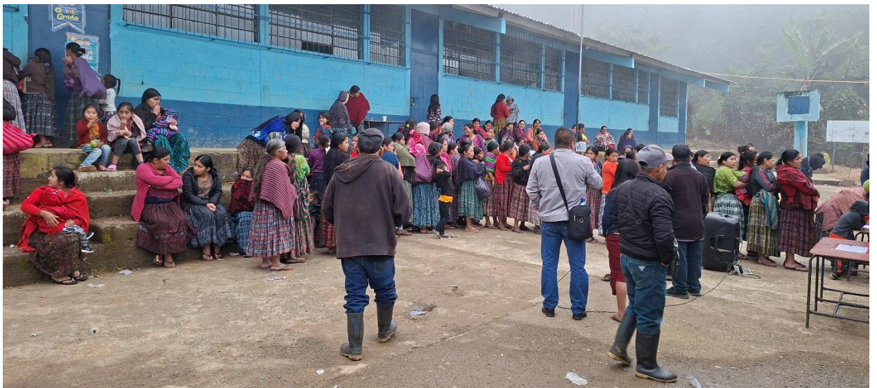
Comonhoj: Unterzeichnung des Protokolls der „Gemeindeversammlung“ Ende 2025 mit dem Beschluss über die Realisierung des Trinkwasserprojektes.

Mit gleicher Post erhalten Sie die Rechnung für Ihren Jahresbeitrag, wie er an der VV 2025 beschlossen worden ist.