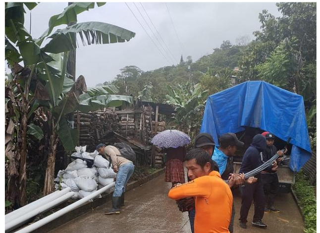
Materialanlieferung für das Projekt Comonhoj. Auch bei Regenwetter wird gearbeitet!

Anträge an die Vereinsversammlung sowie Abmeldungen können Sie via Internet auf www.tamahu.org einreichen. Unter dieser Adresse finden Sie auch die Unterlagen zur Vereinsversammlung.