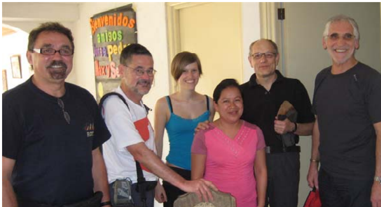
Die Reisegruppe 2010 vlnr.

Vor rund 15 Jahren hat Walter Grimm seine Tätigkeit – aus der später der Verein Tamahú entstand – hier in Tamahú aufgenommen. Diese Tatsache hat der Verein Tamahú zum Anlass genommen, die Situation gründlich zu analysieren. Viel ist inzwischen erreicht worden. Doch ist dies nachhaltig geschehen. Rechtfertigt sich der grosse finanzielle und arbeitsmässige Aufwand. Das wollte Walter Grimm mit einem längeren Aufenthalt im Dorf Tamahú herausfinden. Er lebte 4 Wochen im Dorf und hatte reichlich Gelegenheit, die Beurteilung der Projekte durch die einheimische Bevölkerung in Erfahrung zu bringen. In der Hälfte seines Aufenthaltes stiessen weitere Vorstands- und Vereinsmitglieder dazu, um einzelne Aspekte vertieft abklären zu können und um mit den Partnern vor Ort – gestützt auf die gemachten Erfahrungen – Verhandlungen zu führen. Über allem steht schliesslich das Ziel, die in Tamahú erreichten Erfolge mittel- und langfristig zu sichern.