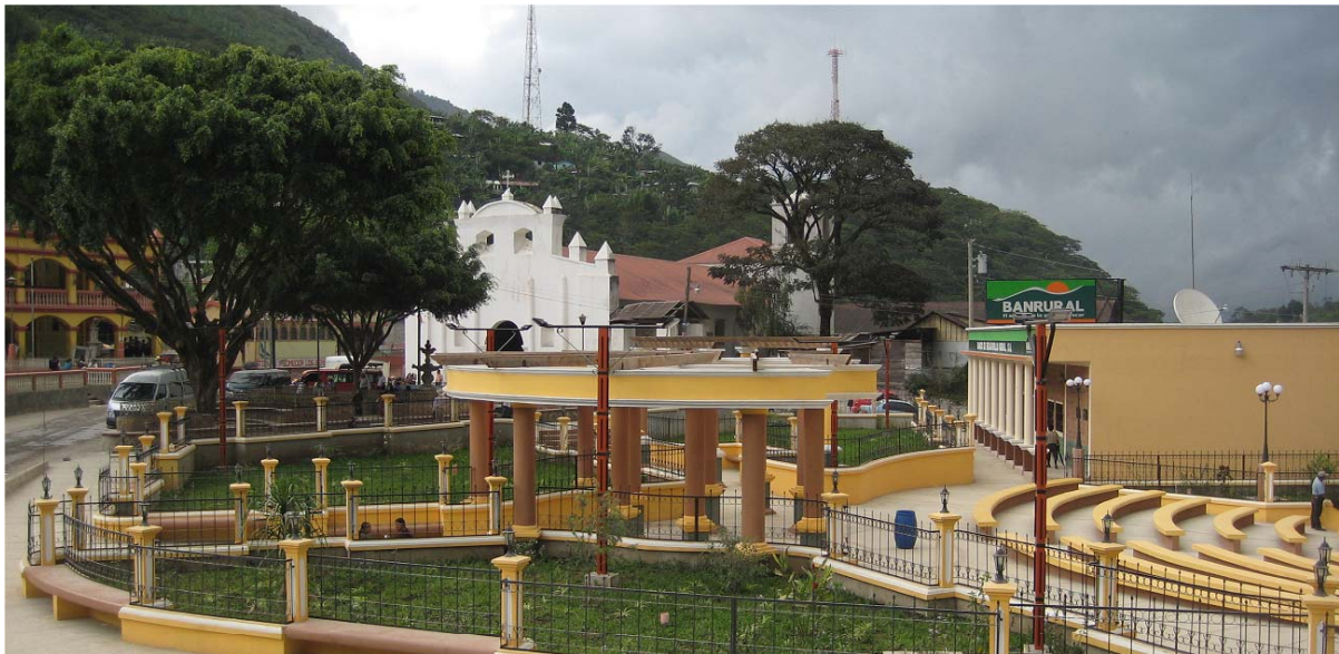
Das neue Zentrum von Tamahú. Der wirtschaftliche Aufschwung wird sichtbar.

Durch das Polochic-Tal wird im Moment eine neue Verkehrsachse gebaut. Sie verbindet die Karibik sowie die Kraftwerksbaustellen im unteren Talabschnitt mit dem Zentrum des Hochlandes, Cobán a.V. und weiter nach Ciudad de Guatemala. Der Einfluss, den diese Strasse auf die Siedlungen im Tal haben wird, ist bereits jetzt abzulesen.